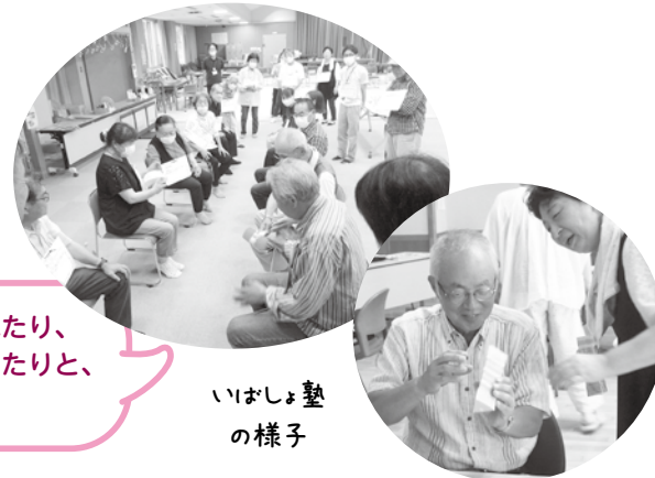
いばしょ塾の様子

まず集まりの場に取り組まれている方や、取り組みたいと思っている方の仲間づくりと、お互いの情報交換の場づくりからはじめました。