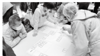
地域の防災力アップの学び