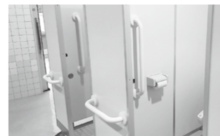
いきいきセンターのトイレを安心して利用いただけるように手すりを新たに設置しました