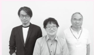
くらしの困りごとをお聴きます