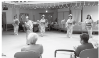
地域のボランティアさんとの交流(デイサービス)