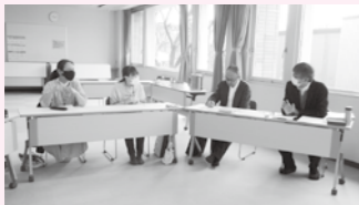
民生委員・児童委員さんから日頃の活動状況をお聴きました