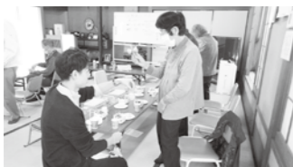
サロン活動の状況をお聴きました(島川サロン)