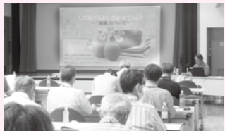
「心配ごと」を聴く相談員研修