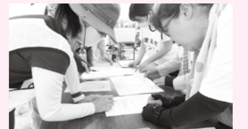
災害時の役割(災害ボランティアセンター)