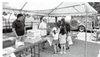
「福祉防災」を子ども達へ…(インクルパーク)