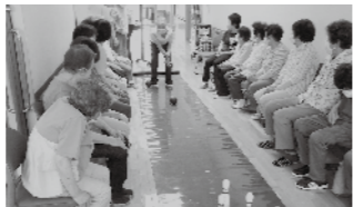
1日プロデュース事業「ひだまり」にて～みんなと笑顔でレクリエーション～