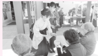
みんなで協力して「マルシェ」に取り組みました