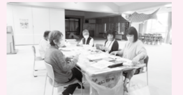
ボランティアさんと一緒に地域活動を推進します