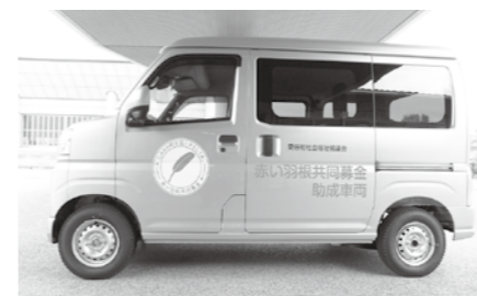
地域活動へ出向くための車両を購入しました

引き続き、財務規律の強化や経費の節減を図りつつ、デジタル技術の活用による効率化や介護職員等の処遇改善など、今後の事業活動に備えた対応を図ってまいります。