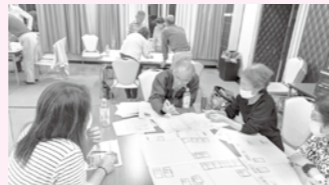
「福祉防災」についてみんなで学びました