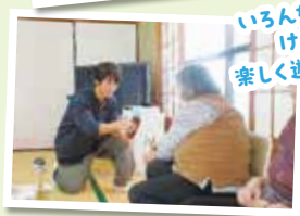
いろんなタイプの けん玉で 楽しく遊びました♪