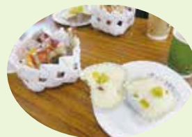
おいしいおやつ ごちそうさまでした!!

けん玉をきっかけに、参加者とボランティアさんが一体となり、みなさんニコニコの良い表情をされている様子がみられました!楽しいレクリエーションの後は、ボランティアさん手作りのおやつとお茶でホッと一息して、歓談タイムを過ごされました ☺とても心温まる場でした♪