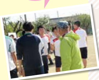
笑顔でハイタッチ!

生徒さんは「楽しかった、また来年もしたい」、市老人会の参加者からは、「3月の卒業間際の時期に試合したい、成長が見たい」と言われており、早くも今年度2回目が実現できそうです♪継続してできるといいですね。