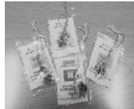
ぞうりストラップ