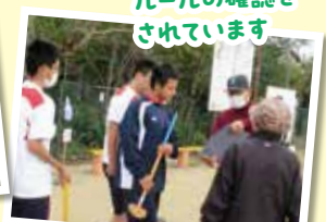
ルールの確認を されています