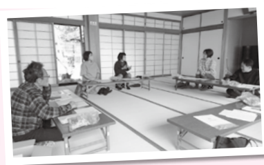
見守りサポート会議の様子