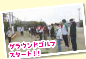
グラウンドゴルフ スタート!!

10月6日(金)の午後、市老人会のみなさんと愛知高等養護学校2・3年生の生徒さんが、グラウンドゴルフを通して交流されました!!