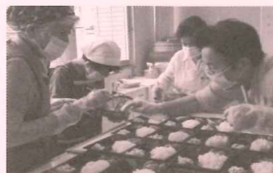
あったか弁当・ふれあい弁当 配食事業

75歳以上のひとり暮らし高齢者 さん等へ手作りのお弁当を届け、見 守りを行ないます。(写真は調理ボ ランティア「ほのぼの会」)