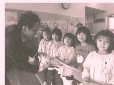
歳末たすけあい訪問事業

町内各地域で進めていただいでい る、ふれあいサロンの活動者が集ま り、情報交換やレクリエーションを 学んだりしています。