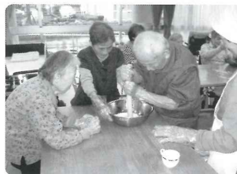
男性利用者さん、初めてと思えない手際良さ♪