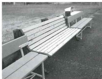
松尾寺北の公園に設置されたベンチ

助成を受けられた自治会のみなさまから、「貴重な赤い羽根共同募金の助成をいただき、ありがとうございます！」とお声をいただいています。