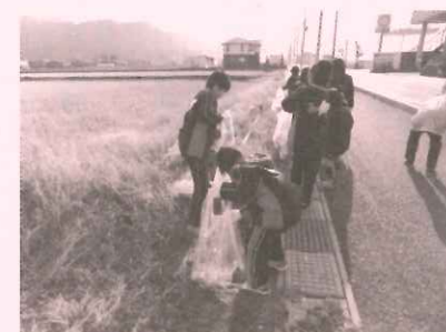
ボランティア協議会つむぎ

町内の福祉に関するボランティア グループなどの活動を支援してい ます。(写真は手話サークル「ゆびゆり」 小学校での福祉学習)