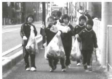
120kgのゴミが集まりました!

12月の寒さが感じられる中、子どもから大人までが清掃を通してボランティア活動を行い、和気あいあいと暖かな交流をされていました。