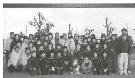
活動終了後みんなで記念撮影