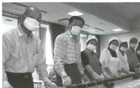
ジャンボ巻き寿司作りでの交流

「ボランティア活動の啓発」と「つむぎの周知」を目的に、中山道宿場まつりや66かまど祭での清掃活動など町のイベントのお手伝いをしてきました。3月にはボランティア交流会を実施する予定です。