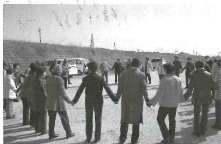
視察研修会での会員同士の交流