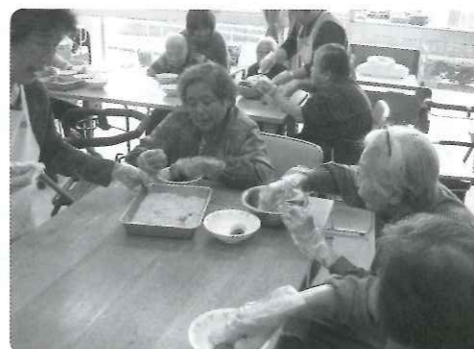
ボランティアさんもおはぎ作り

また、利用者のみなさんから「こんなことしたいわ」とのリクエストのもと、いろいろな活動に取り組み、たくさんの笑顔に出会えるデイサービスをめざします。