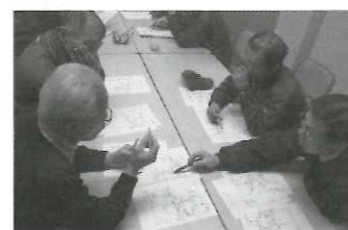
危険箇所、安否確認が必要な人など色分けしてチェック

東円堂防災・減災支援隊は、「居間地域に多い人が、忙しい自警団員をバックアップしよう」と25名の有志で結成されたボランティア組織です。2月4日(月)9回目の訓練は、区ごとの地図を広げ、災害時の①危険箇所(通れなくなる道)、②要介助者等の確認です。「このブロック塀は崩れそう」、「一時待機所はどこにする?」と活発な意見交換が行われ、1時間半ほどで支援マップが完成しました。