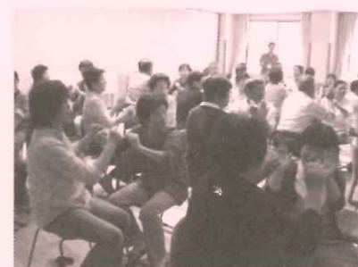
ふれあいサロン連絡会議

ボランティア推進活動として、町 内の清掃をおこなう「クリーン作戦」 を開催されました。