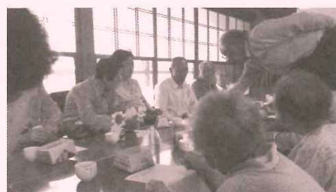
高齢者等ふれあいサロン活動助成事業