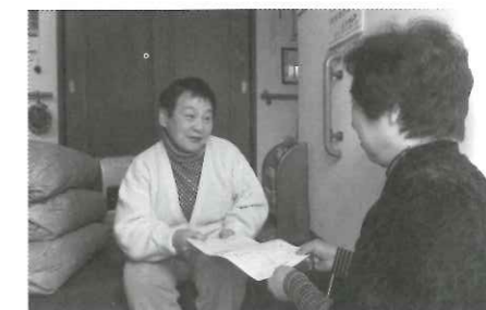
調査票をお渡しします!