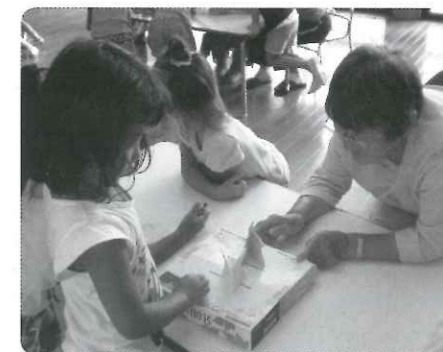
子どもたちとゲームに挑戦中！

コマまわしやお手玉といった昔なつかしい遊びと一緒にさせてもらうこともあり、園児がやり方や上手にするコツをいっぱい聴いてきてくれて、利用者の方が円の中心になって先生役になることもよくあります。