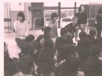
ボランティア団体や 活動への支援

75歳以上のひとり暮らし高齢者 さん等へ手作りのお弁当を届け、見 守りを行ないます。(写真は調理ボ ランティア「ほのぼの会」)