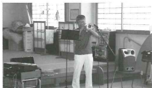
福祉施設でトランペット演奏