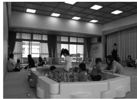
わんぱくひろばの雰囲気