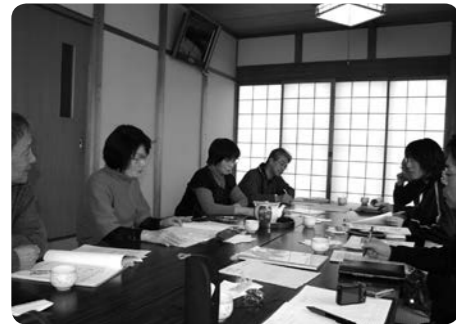
目加田の見守り体制について意見交換