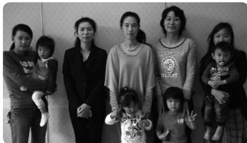
「お話仲間が増えることを楽しみにしています」と会員のみなさん

高齢者や子ども、そして私たちが安心して地域で暮らせるよう、地域で支え合うネットワークづくりや地域にあった見守り体制・活動について話し合う場を「見守りサポート会議」と言います。平成23年度には、目加田・栗田・豊満・沓掛の4自治会をモデル地区として取り組んでいただきました。平成24年度からは、この取り組みを町内各自治会に拡げていく予定です。