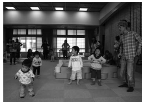
大人気！アヒルのダンス！！

毎週3回（月・水・木）、未就園児とその保護者さんを対象に「わんぱくひろば」を開所しています。