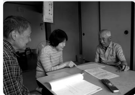
見守り訪問の様子

目加田自治会では、「役員が交代しても福祉活動が続けられる組織、10年後も見守りを続けていける組織をつくりたい。」という目標のもと、平成23年度に2回、平成24年度に1回、「見守りサポート会議」を開催しています。