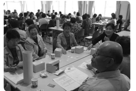
身近な設問に盛り上がったクロスロード

今年度から社協の地域福祉活動計画とともに活動を進めていくため、総会の中で計画の内容について学び合いました。また、交流会としてゲーム「クロスロード※」をおこない、日常生活に起こりうる問題に、悩んだ表情で取り組む参加者の姿が見られました。終始和やかな雰囲気の中で参加者同士の交流を深めることができ、今後もこのようなボランティアの交流の場を開いていく予定です。