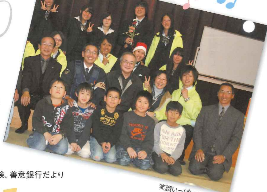
笑顔いっぱいの集合写真