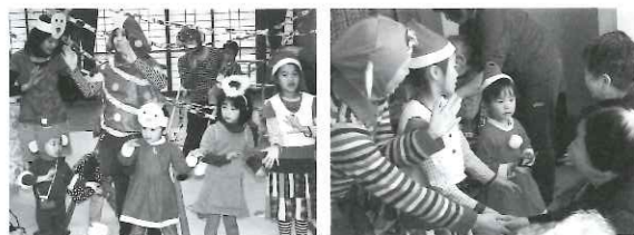
楽しいクリスマス♪