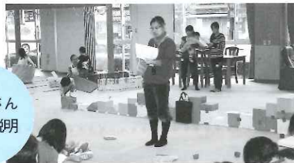
看護士さんからの説明

1月6日(木) わんぱくサロンで救命救急講習会を行いました。NPO法人ぽぽハウスの看護士さんから「赤ちゃんと子どもの応急手当て」として消化の良い食事の参考例やウイルスの予防法などの講習を受けました。一緒に講習を受けた指導員さんも「実際身につけておくべきことを忘れていた事も多く、よい機会を与えていただき喜んでいました。」と話されていました。