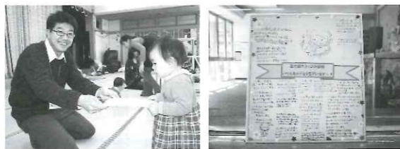
寄せ書きありがとうございます いただいた寄せ書きです

子育てサークル「HIMAWARI」さんから愛の郷スタッフの皆さんに「いつもお世話になっているので」と寄せ書きをいただきました。