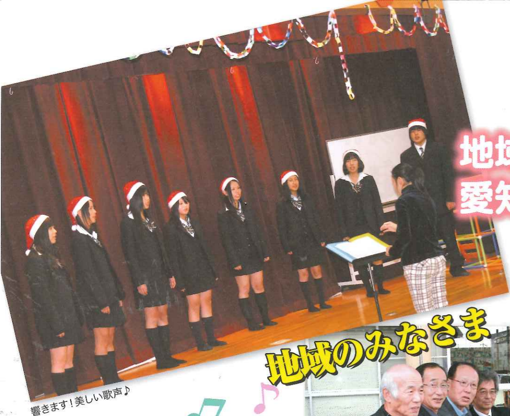
響きます!美しい歌声♪