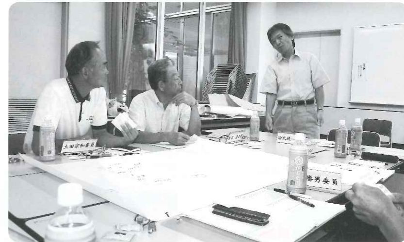
社協パートナーミーティングの様子

現在、愛荘町社協では地域福祉活動計画を策定しています。社協では合併後、様々な事業を継続して実施してきました。合併後、町の新しい福祉課題を把握するために、平成19年度住民意識調査を実施し、平成20年度には調査結果の分析を行い、その結果をもとに事業計画を策定しました。しかし、その事業計画は単年度の事業を中心とし