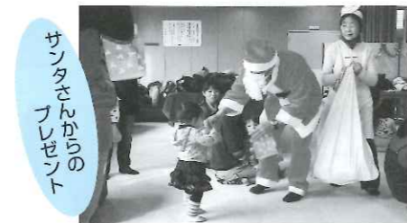
サンタさんからのプレゼント