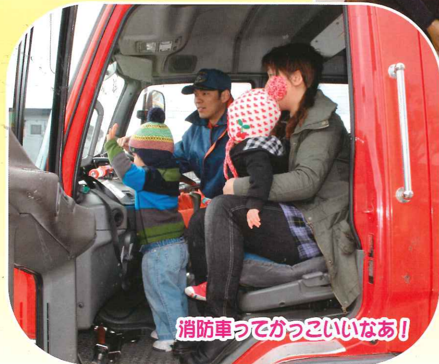
消防車ってがっさいいなあ!