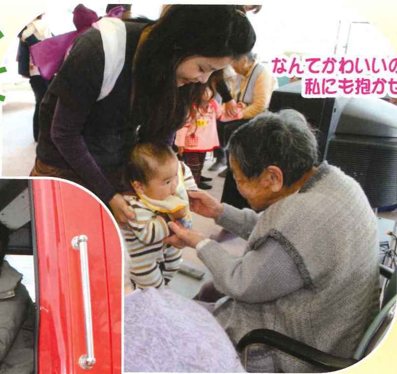
なんてかわいいの! 私にも抱かせて