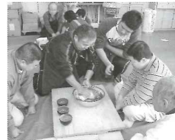
みんなで力を合わせて練っていきますが、均等に伸ばしていくのは難しいです。一番これが大変なんです。