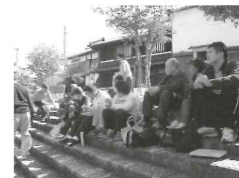
←八幡堀でお弁当を食べました。良い天気で気持ちよかったです。