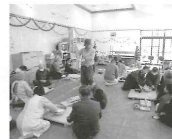
西村先生から、作り方を教わります。さあ、これから!