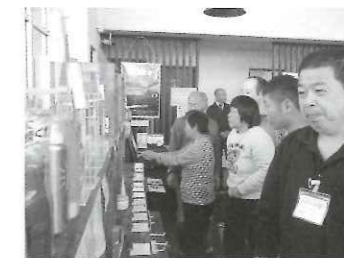
←あっ、これ知っている!使ったことある!」いろんな発見がありました。