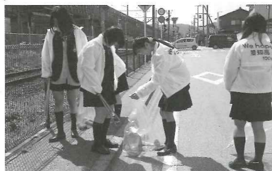
愛知高校生徒会のみなさん

3月8日(月)愛知高校の生徒会のみなさんが、入試前日に少しでも周辺をきれいにして気持ちよく受験生を迎えられるようにと、愛知川駅から学校までの通学道路等のゴミ拾いをされていました。今後も計画的にこういう活動ができればいいなと考えているそうです。受験生もきれいな歩道を歩いて、気持ちよく受験にこられたのではないのでしょうか。地域のみなさんも温かく見守っています。