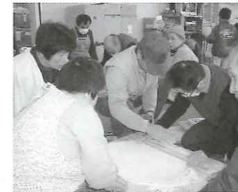
ゆっくりしていけないね。

こうした作業所での活動を家族と一緒に経験することで、日常の家庭生活においてなかなか見られない姿を見ることが出来ます。いろんな発見と家族の絆というものを再確認できる良い機会なのではないでしょうか。