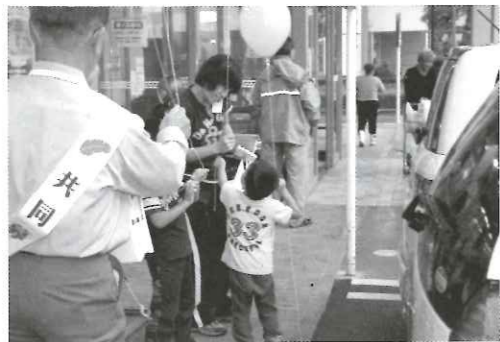
赤い羽根共同募金運動を展開します