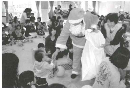
わんぱくサロンにサンタさんがきたよ!