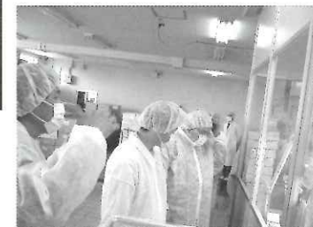
↑製造工程において、みなさん手際よく作業されています。