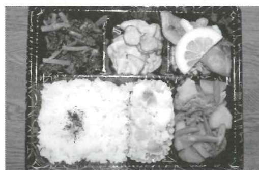
ボランティアさんの手作りお弁当