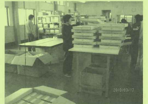
早速作業に利用させていただいています。

ありがとうございました。 県の広域助成を利用し、町内の福祉施設「セルフはたしょう」（愛荘町軽野）さんが、作業棚と作業机を購入されました。 新しい広い机と棚が入り、施設の利用者や職員の方々から感謝の声をいただいております。 共同募金は、県内の福祉施設や町内の地域福祉活動の財源として大きな力となっています。