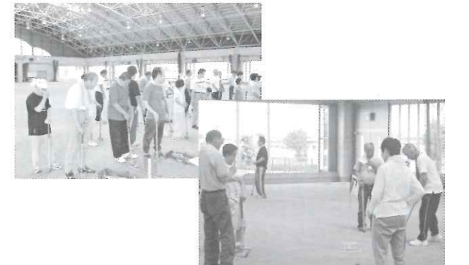
楽しい1日をありがとうございました。

いっぱい運動したらお腹も減り、昼食もみんなで一緒にいただき、大変楽しい1日を過ごしました。お世話になりました民生委員児童委員さんありがとうございました。