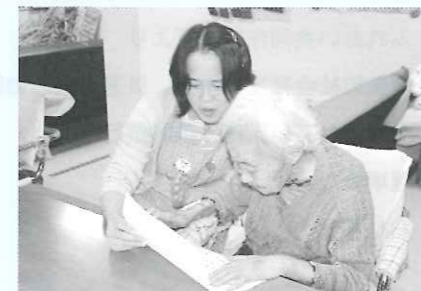
一緒にゆっくりと歌を歌います♪

見学はいつでもOKです。ご利用をお待ちしております。ゆとりのあるサービスを心がけています。