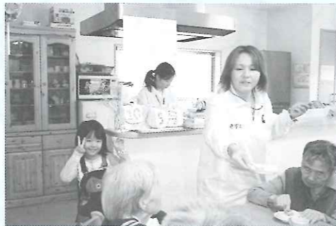
〔3時のおやつ〕 みんなでロールケーキを分け合いました 女の子はスタッフの娘さんです

名称：特定非営利活動法人 きずな 代表者名：今村 秀子 設立年月日：平成20年5月2日 住所：長野2380番地11 電話：42-8300