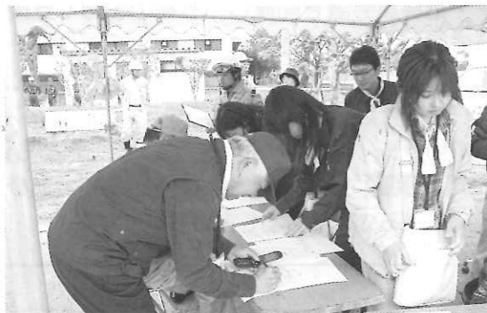
ボランティア登録の模擬受付の様子

このような訓練を常時行い、何が必要なかを準備し常に改善していきながら災害に備えておく必要を感じました。