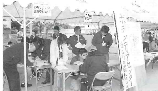
ボランティアセンターを設置しました。

訓練には、周辺地域のボランティアさん・民生委員児童委員さん・滋賀県社協職員等、多くの方のご参加をいただき、「災害ボランティアに依頼したい困りごとの受付」や、「ボランティア登録」「ボランティアの調整」「要援護者