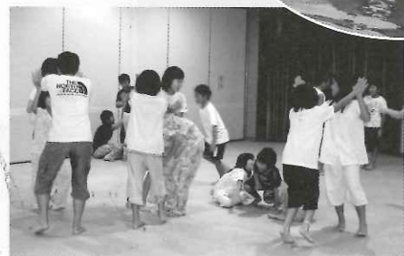
寝る前の楽しいレクリエーション