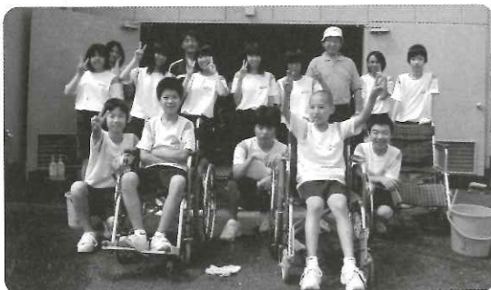
【中学1年から3年までが協力しました!】

7月24日(金)に愛知川自治会の中学生(13名)が、愛の郷にある貸出用車イスの清掃・点検をお手伝いしてくださいました。大切な夏休みにも関わらず、暑い中の活動をありがとうございました。