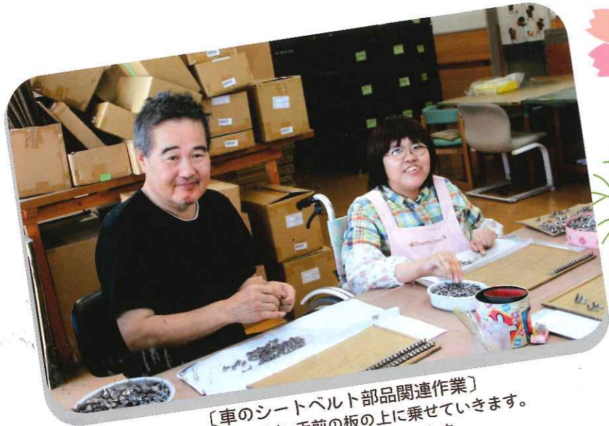
〔車のシートベルト部品関連作業〕 組み立てた部品を、手前の板の上に乗せていきます。 1人で毎日2～6枚の板を完成させます。