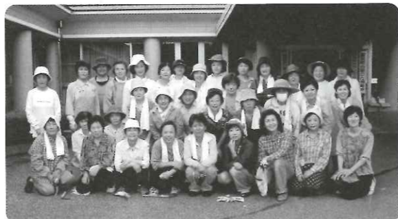
【毎年のご奉仕をありがとうございます】

7月9日(木)に今年も愛荘町商工会女性部(45名)が早朝6:30から愛の郷の清掃奉仕活動をしてくださいました。植木の剪定から草むしりまで、広い範囲の清掃をありがとうございました。