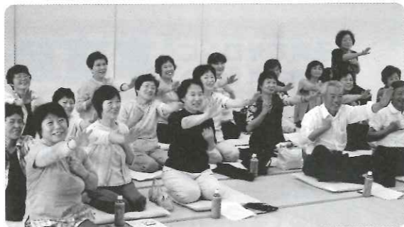
【右手はパー左手はグー できましたか?】

7月11日(土)に福祉センター愛の郷にて「ふれあいサロン連絡会議」(44名参加)を開催いたしました。特別な準備をしなくてもレクレーションができることを学んでいただきました。次回の会議には「町内サロンの事例報告」「ボランティア同志の話し合い」などを計画しています。