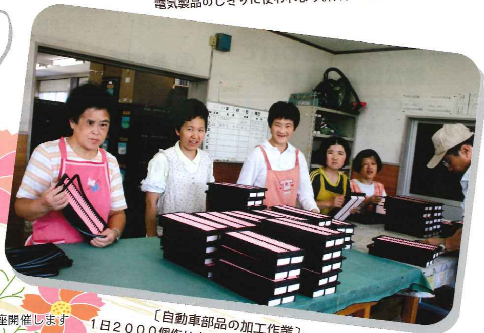
〔自動車部品の加工作業〕 1日2000個作ります。車検の時に取り替える部品です。 何かわかりますか??