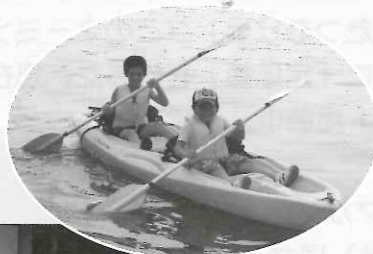
安土町海洋センターにてカヌー体験

福祉センター愛の郷で一泊して、集団生活のルール・マナーの大切さを学び、福祉についての関心を高めることを目的としています。今年は、町内各小学校から23名の児童が参加しました。