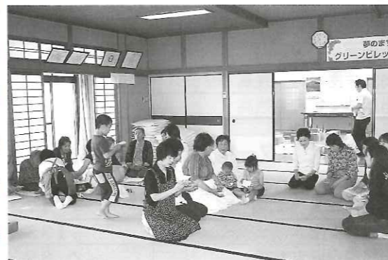
この日は、子ども会の行事と重なってしまい参加者さんが少なくて残念でした。

「わいわいサロン」とは「わいわいいきいきサロンスタッフ」が中心となり、幼児から高齢者までが集まれる場として開催されています。この日は、グループに分かれてのピンゴゲームもおこないました。