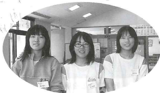
【ふれあい共同作業所に来てくれました】