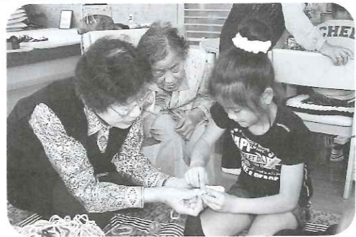
【指編みを教えてもらいました】

ココで「あしょうが」のひととかが 仕事をしていました。その中でぼ くたちも一作業をしてみました。ど もその仕事で「一」作っても2冊たそう です。また仕事をしたいです。