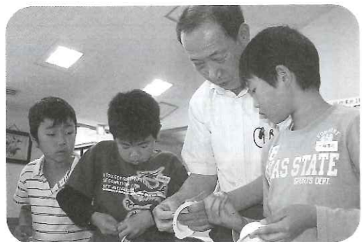
【作業所の作業を体験しました】

5月25日(月) 29日(金)、6月1日(月)の3日間にわたり、71名の児童の方が愛の郷にて「福祉学習」を行いました。子どもの時から福祉に関心を持ってもらえることは喜ばしいことです。参加してくれた児童の感想文の一例をご紹介します。