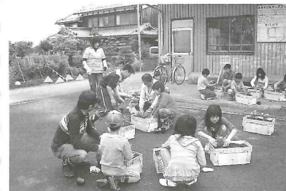
子ども会みずから苗植をおこなっています。

5月24日(日)に「花いっぱい運動」が行われました。「自分の住んでいる円城寺にうるおいを!!」と「福祉会議」が中心となって、年に2回取り組んでいます。10年以上前から取り組んでおられ、子ども達も福祉活動に参加しています。登校前に水やりに取り組むなど、やさしい心が育っています。