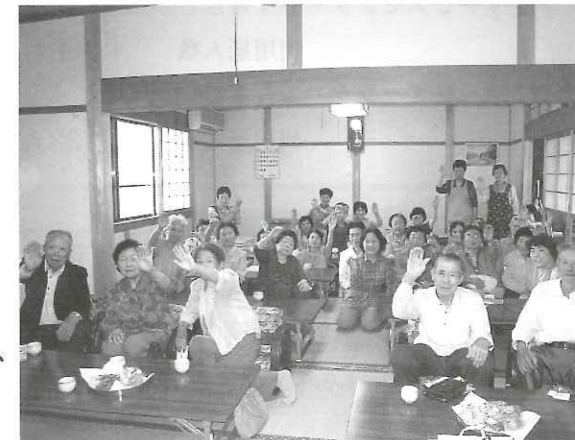
認知症サポーターの証となる「オレンジリング」を手にする参加者さんとキャラバンメイト

6月18日には「認知症キャラバンメイト」が演じる寸劇を見た後、認知症の人の家族を温かく見守る応援者としてどんなことに気をつけたいか、などの話し合いをしました。