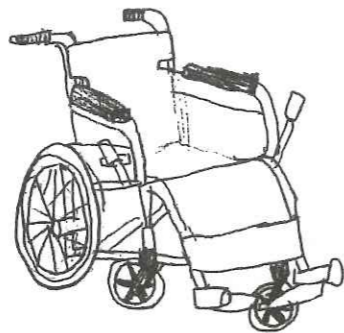
(羽柴理功さんのイラスト)

「自治会(字)でこんな福祉活動をしている」という情報がございましたら、愛知川事務所までご連絡ください。取材に寄せていただきます。