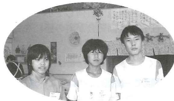
【デイサービスに来てくれました】