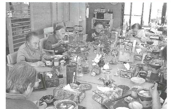
手作りの昼食。にぎやかな食卓です。

利用料: 1回1000円(昼食代込み) 半日利用は200円のみ 利用日: 月・水・木・金曜日から選んで(木曜日は半日利用日です)