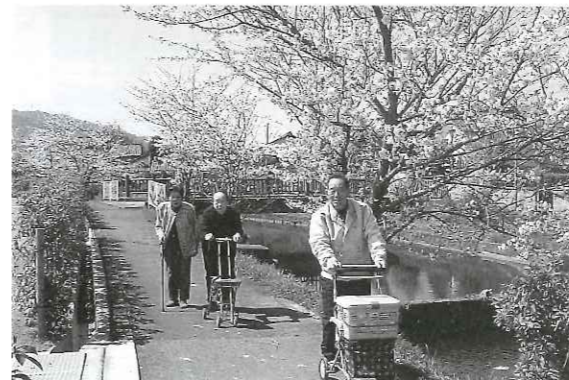
春にはお花見へ行きます(今年は五個荘中央公園に行きました)