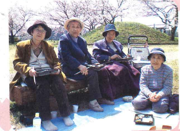
老いも若きも 元気いっぱい