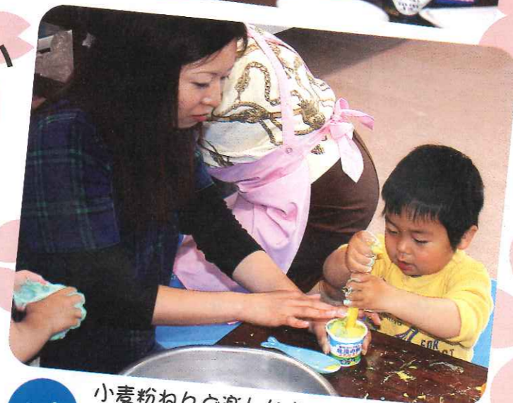
内容 小麦粉ねんど楽しいよ (同級生クラブ)