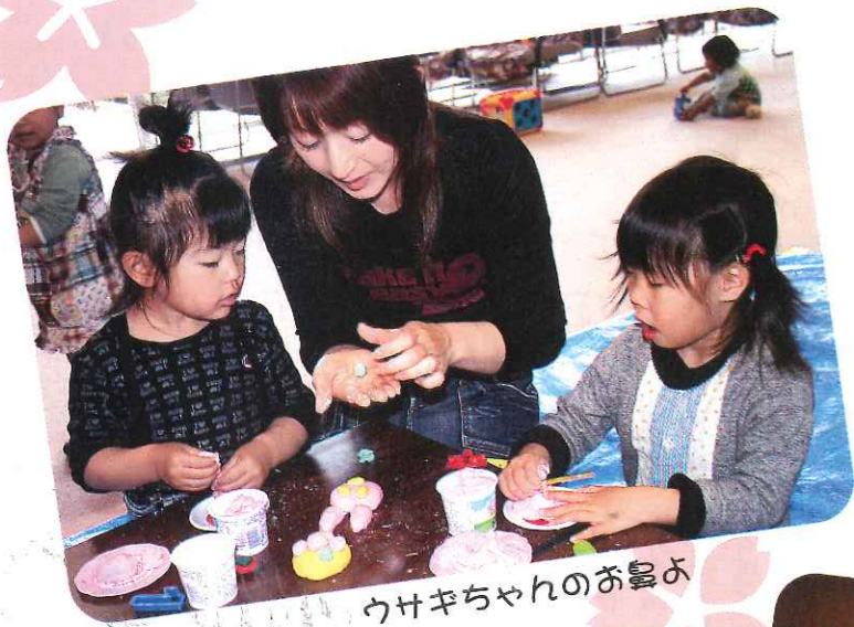
うけぢちゃんのお昼