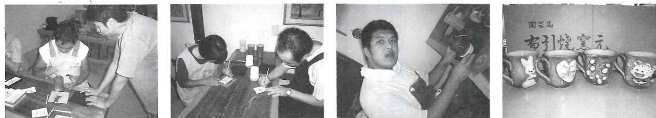
コップの底は慎重に! どんな図柄になるかな・ ・ うまく焼けますように マイカップ 完成!

ふれあい共同作業所で作成した木工作品(花台など)を窯元さんに納めております。その窯元さんのご協力をいただき、陶芸を体験いたしました。自分で選んだ図柄の下書きや貼り付け作業など、慣れない作業で苦労していましたが、それぞれ個性のある作品が完成しました。マイカップで飲むお茶やコーヒーはとてもおいしいことと思います。