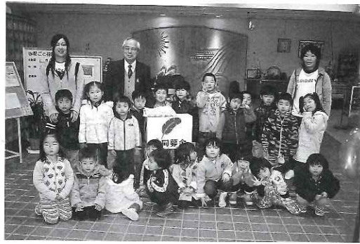
かわいい子どもたちも 共同募金にご協力いただきました。 (町内保育園児)

平成21年度予算は、3月の理事会 および評議員会で承認されました。 一般会計予算は、前年度比0.5%の 微増となりました。 今年度は、指定管理事業者として 最終年度を迎え、社協本来の地域福 祉活動を新たな視点で取り組む計画 を進めるなか、経常経費については 節減に努め、介護保険等自主事業は、 量より質の高いサービスをめざしな がら、限られた予算で効率的な運営 を図る予算となりました。 なお、ふれあい共同作業所は、制 度改正で就労支援B型事業に移行し、 就労支援事業特別会計として予算計 上しました。