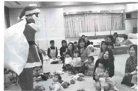
わんぱくサロンにサンタクロースがやってきた!