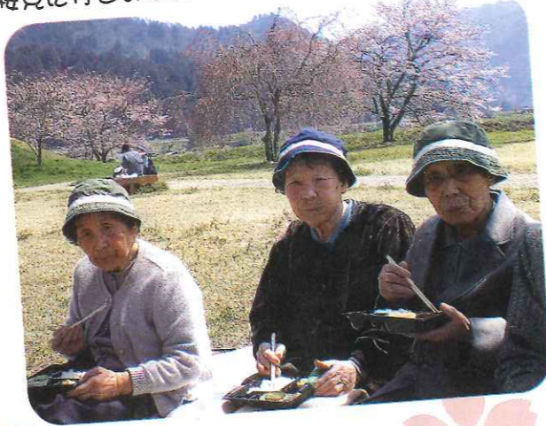
縦見に行きました (秦荘いきいきディサービス)