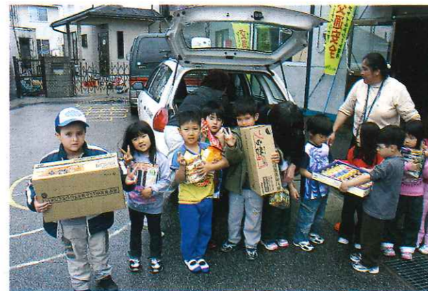
社協あいしょうは再生紙を使用しています

皆様から寄せられた生活支援物資の一部を4月に2回にわたり、しが外国籍住民支援ネットワークとコレジオサナタナ学園へ物資を提供いたしました。