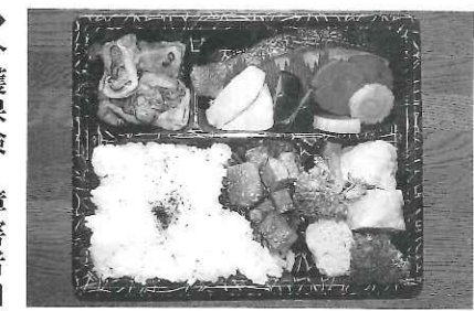
【赤い羽根共同募金運動】 地域見守り訪問事業にてボランティアさんによるお弁当