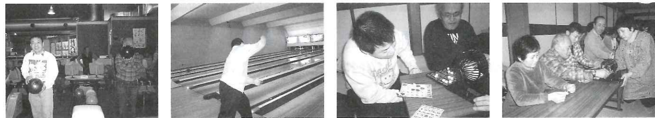
さあ いくぞー エイヤー! ビンゴゲーム 早くそろろうといいのにね! なかなか そろわないなあ

お世話になりました民生委員さん、消費生活研究グループの皆さん、ありがとうございました。