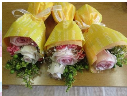
(株)花好 さま 「ブーケ風花束」

今まで協賛いただきました企業・事業所様からの品物を一部ご紹介します😊 頂きました品物は、お配りさせていただきました！ありがとうございます。