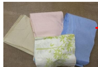
ウェスティ工業(株) さま 「はぎれ布」

2 事業所様からいただいた品物を、 町内のボランティアさんが加工し、 箸袋が完成しました！！ 町内のボランティアさんの活動の 取り組みにもなっています！！