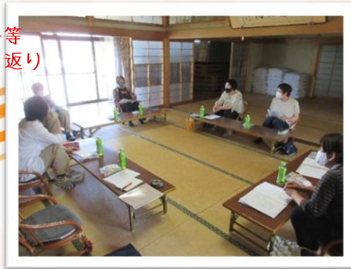
沖サポート会議の様子