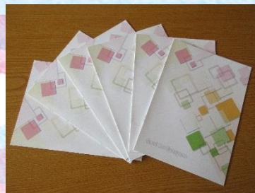
近江印刷(株) さま 「ノート」