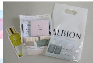
コスメティックにしむら さま 「化粧水・乳液等試供品」