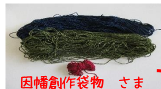
因幡創作袋物 さま 「紐」