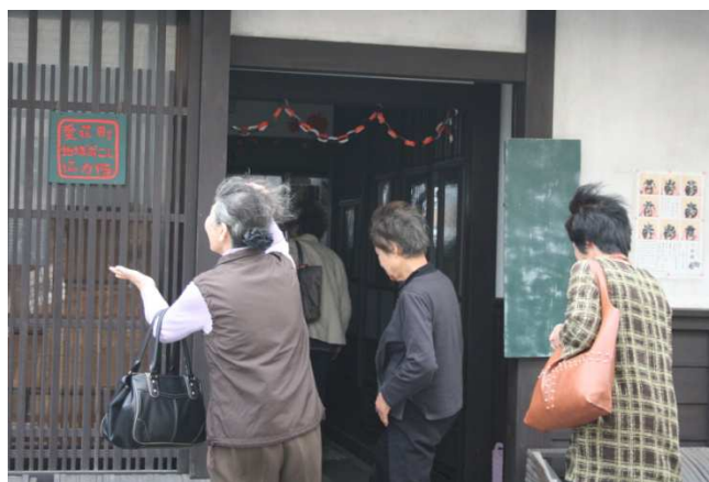
初めておうちに入るボランティアさん